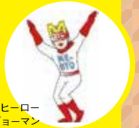
未病改善ヒーロー ミビョーマン