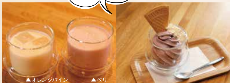
▲オレンジパイン ▲ベリー

左: フルーツ甘酒スムージー (ICE) ¥550 「飲む点滴」といわれる甘酒には、女性に嬉しい健康・美容効果がいっぱい。フルーツが加わって飲みやすい。